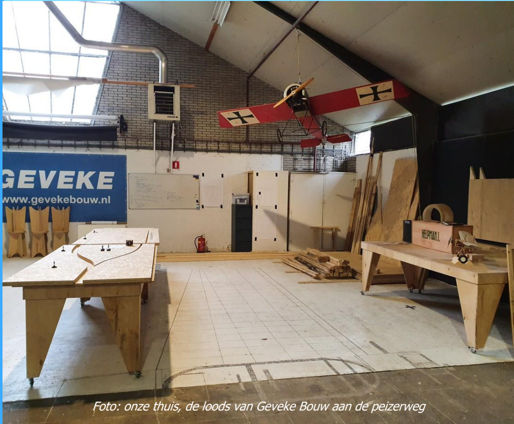
Foto: onze thuis, de loods van Geveke Bouw aan de peizerweg